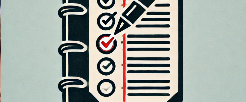
carnet de notes des élèves